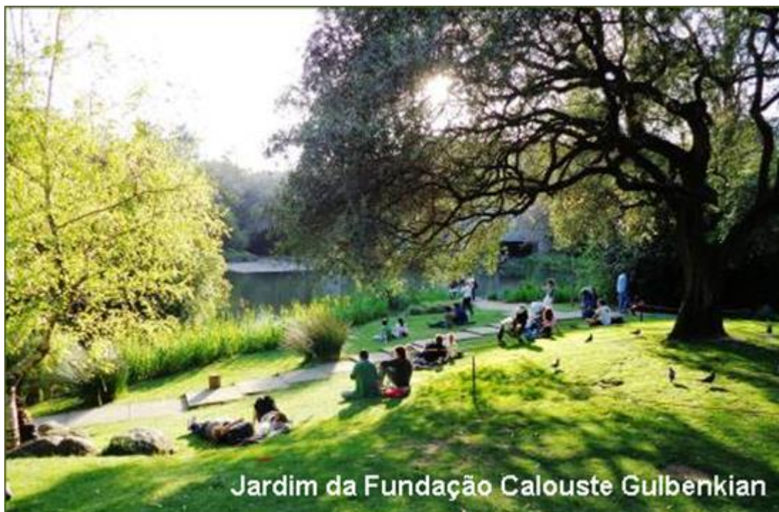
Jardim da Fundação Calouste Gulbenkian

Estão convidados dois palestrantes internacionais para a Sessão de Abertura e está previsto, para o mesmo dia, um debate com intervenção de especialistas nacionais em diversas áreas relacionadas com o tema.