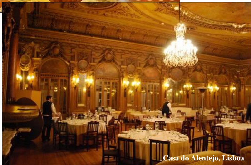
Casa do Alentejo, Lisboa